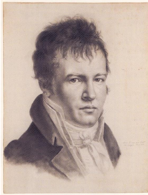
Autorretrato de Humboldt