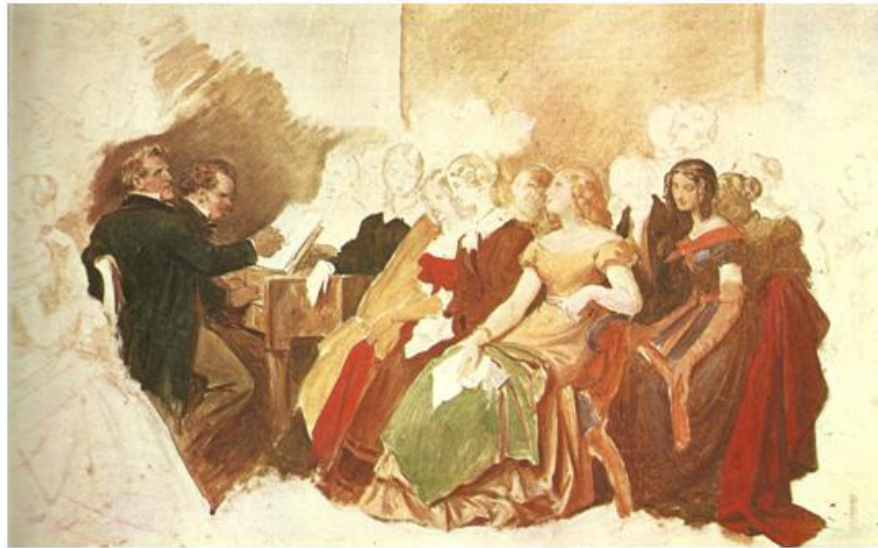
Moritz von Schwind: Schubertiada